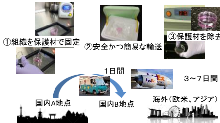
図2. 最終的に目指す細胞輸送システムのイメージ