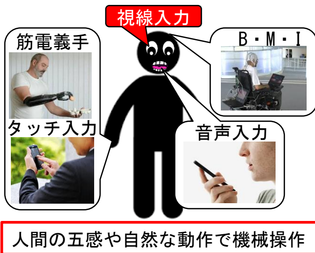
図1. ナチュラルUIの発展・普及